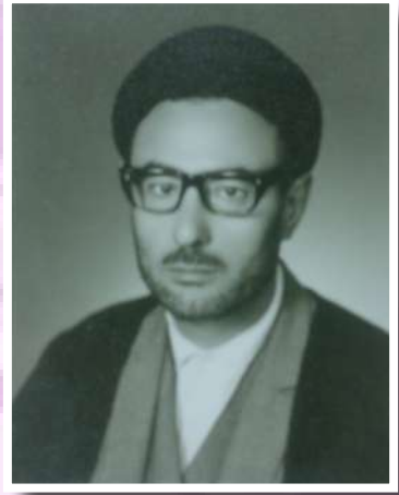
بقلم: الشيخ محمود عبد الرضا الصائفي